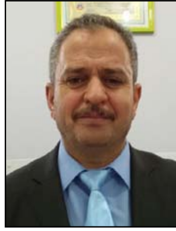
القاضي حبيب ابراهيم