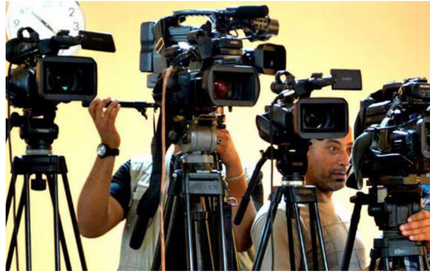
محكمة النشر عززت الحريات الاعلامية في العراق