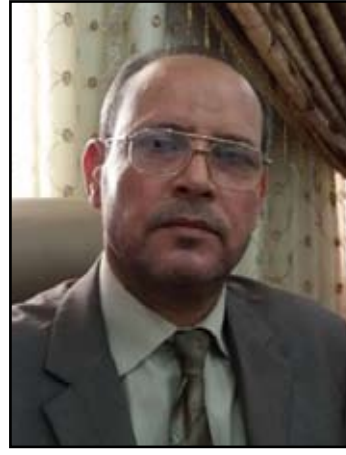
القاضي حسين شاكر