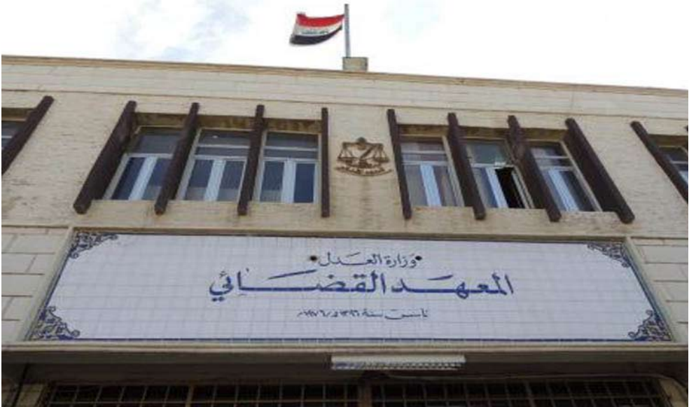
واجهة مبنى المعهد القضائي في بغداد

وتابع أن "قانون تشكيل المحاكم رقم 3 لسنة 1945 صدر بموجبيه تم إبدال تسميه دوائر الإجراء إلى دوائر