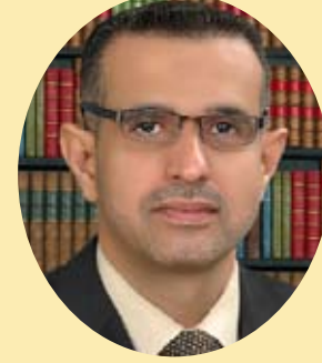
القاضي ناصر عمران