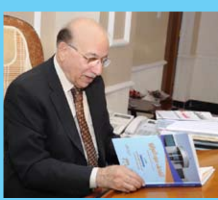
العرض الكامل لكتاب القضاء في العراق (١١) الاصخيرة